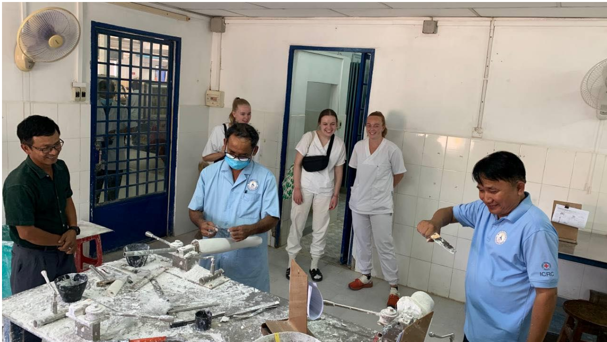
Gipsrommet til rehabiliteringsklinikken i Kampong Speu

Vi besøkte også en rehabiliteringsklinikk i Kampong Speu, som er naboprovinsen til Phnom Penh. Vi fikk dermed et litt større innblikk i hvordan ortopediingeniører jobber i Kambodsja ved å få se hvordan rehabiliteringen fungerer utenfor hovedstaden. Også ved denne klinikken var tjenestene gratis for pasientene.